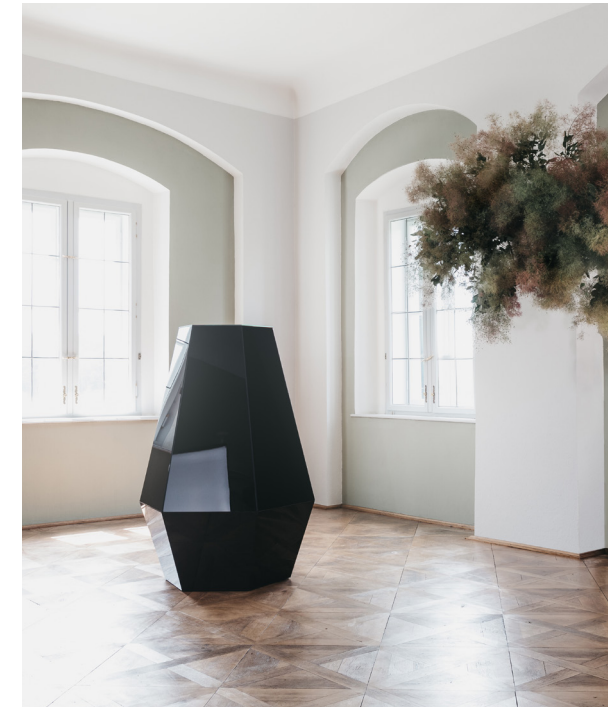
ESG, schwarz glatt